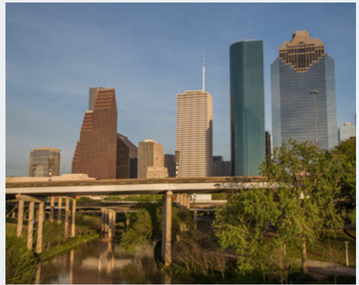
El proyecto de Mejora de Carreteras del Norte de Houston es el proyecto de transporte más grande de la historia reciente de nuestra ciudad.

El objetivo de TxDOT es ayudar a los hogares y a las personas a mantener sus redes de apoyo social actuales. Las interrupciones asociadas con el traslado pueden afectar el acceso de un residente a una estructura social fuerte construida con el tiempo. Esto puede incluir actividades comunitarias (iglesia y escuela) y otras rutinas regulares como compras de comestibles, cuidado de niños y servicios médicos. Las circunstancias individuales variarán, pero las poblaciones minoritarias, de bajos ingresos y de escasa competencia en inglés pueden ser especialmente vulnerables a tales impactos. TxDOT trabajará diligentemente para tratar de evitar que tales efectos ocurran.