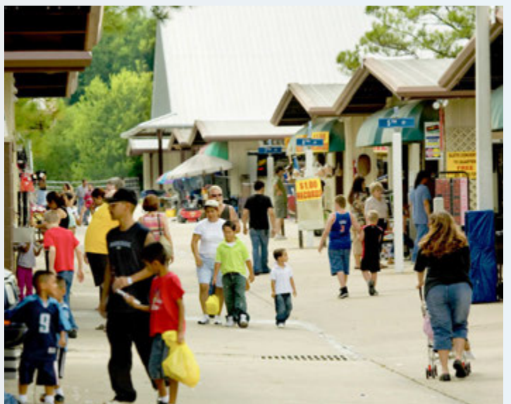
Nuevas mejoras peatonales en todos los cruces y conexiones con elementos peatonales actuales.