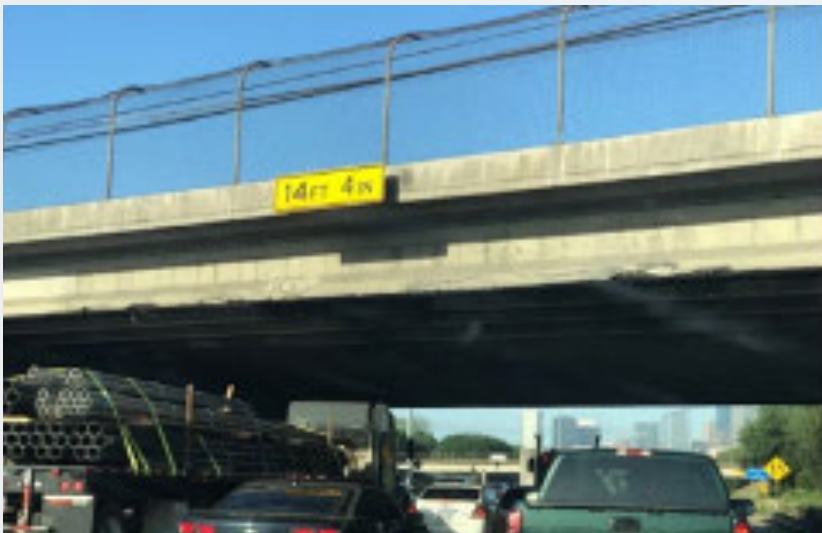
Se levantarán puentes para cumplir las normas nacionales de altura.

Entre 2015 y 2018, hubo 66 incidentes en el área de los Segmentos 2 y 3 del proyecto cuando un puente fue golpeado por un camión que pasaba por debajo, y cuatro golpes de puente en el Segmento 1 durante el mismo período. Este proyecto llevará todas las alturas de los puentes a los estándares más recientes, con el objetivo de reducir los golpes de los puentes a cero. Estos eventos a menudo desencadenan el cierre de toda la autopista para eliminar los accidentes e inspeccionar la integridad estructural del puente, lo que puede causar congestión de parada durante varias horas.