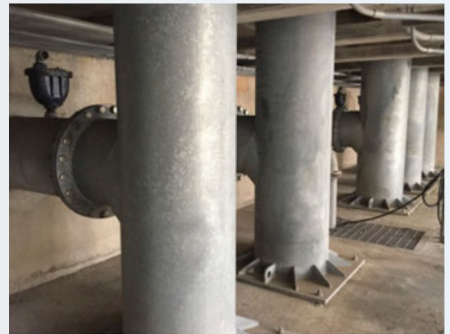
Tubería de Descarga de Bombas