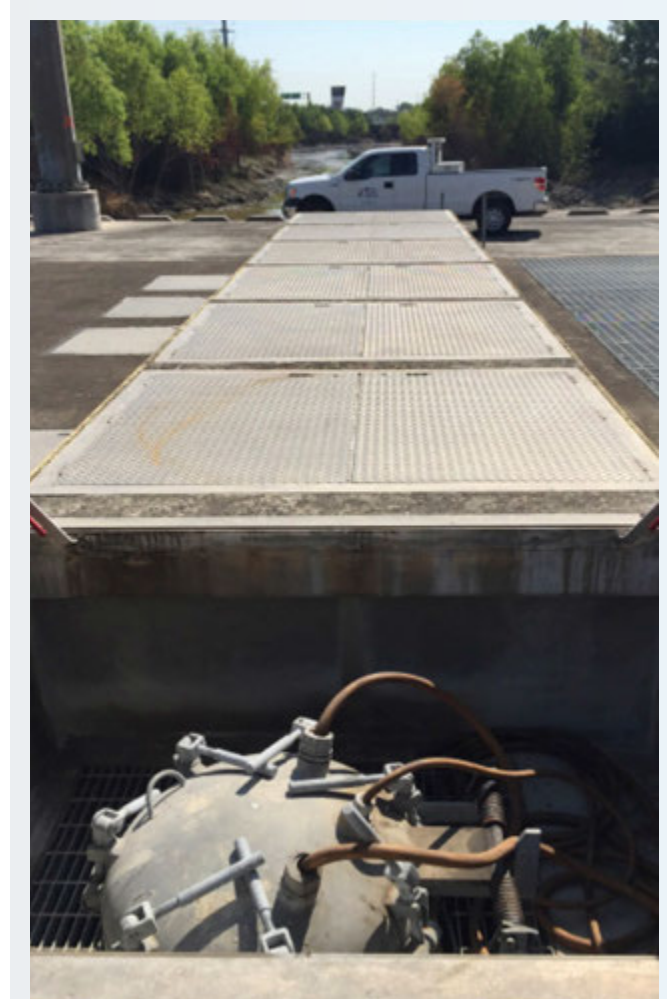
Cubierta de la Bomba de Descarga con Vistas de la Detención

La seguridad es la principal preocupación de TxDOT. Las estaciones de bombeo para las secciones descendidas de la carretera se diseñarán con bombas de reserva y generadores de reserva para reducir la probabilidad de un fallo del sistema de bombeo. TxDOT está actualmente explorando el desarrollo de un sistema de alerta que cerrará el acceso a las secciones descendidas de las carreteras en caso de falla de la bomba.