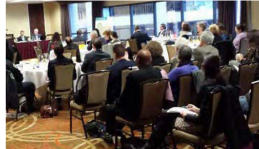
Downtown Stakeholder Working Group, 2013

TxDOT organiza la reunión de diseño de I-35 Capital Express Central para solicitar la opinión de las partes interesadas con respecto a los conceptos previamente desarrollados, incluyendo un plan para construir otra cubierta superior sobre las cubiertas superiores existentes. Se propusieron más de 30 conceptos en el transcurso de la reunión.